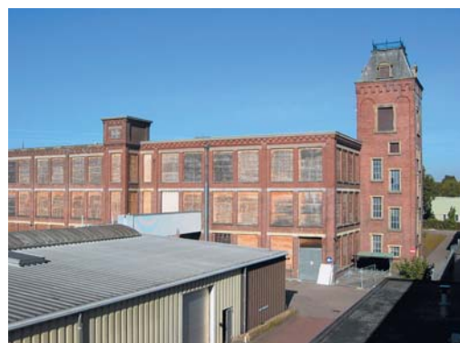
Voormalige spinnerij Oosterveld, Enschede