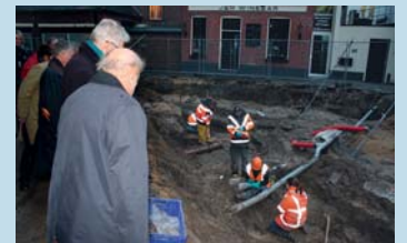
Bezichtiging opgravingen Plechelmusplein Oldenzaal