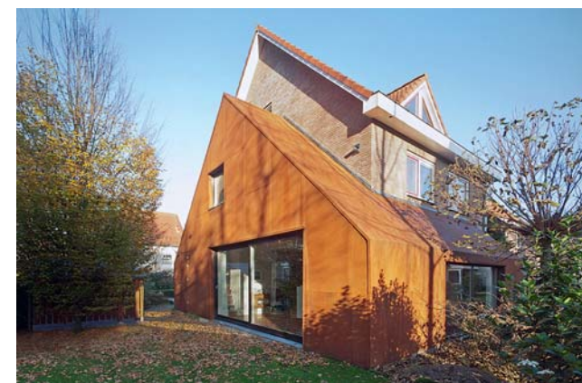
De foto's tonen ontwerpen van aanbouwen in Twente; ontwerpen die meedingen naar de Archie 2011, een publieksprijsvraag uitgeschreven door Architectuurcentrum Twente.