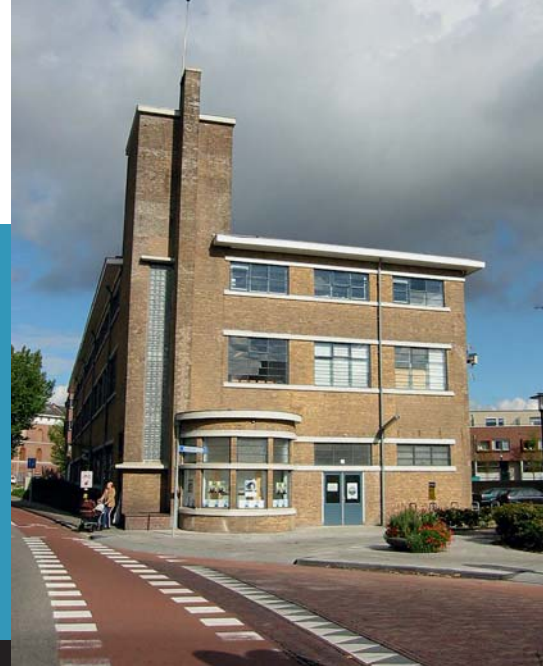
Nu Kunstenlab - voorheen modelmakerij ijzergieterij Nering Bøgel.