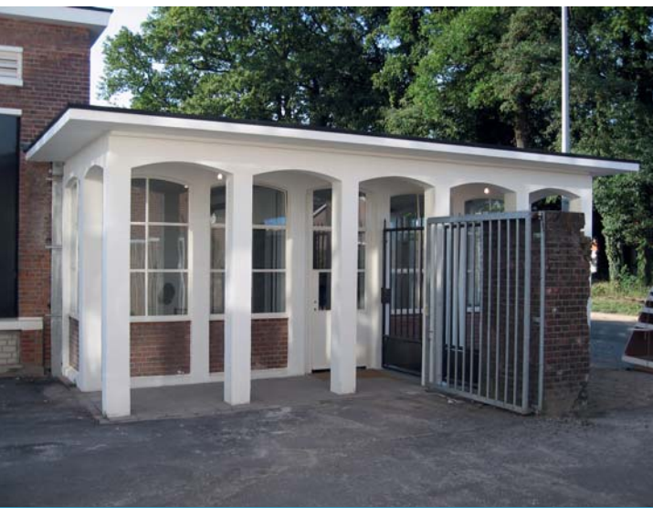
Portiersloge Tetemfabriek Enschede werd Foodlab