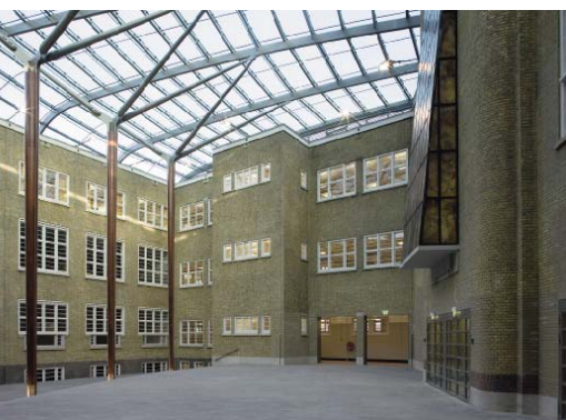
Ambachtsschool Postjesweg, Amsterdam

In deze school van architect Westerman wenste ROC Amsterdam zich te vestigen met een 'city-college'. Om die functie voor de